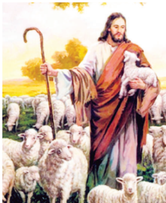
Jesus Cristo é o Bom Pastor, segundo Santo Agostinho

As Diretrizes da CNBB recordam ainda que “a formação pastoral deve favorecer o amadurecimento humano e ético dos agentes de pastoral, de modo que seu testemunho se torne sinal de comunhão, solidariedade e cuidado com os mais vulneráveis” (DGAE, n. 68). A pastoral é, assim, um espaço de conversão permanente, onde se aprende a servir com humildade, a escutar o outro e a discernir o agir conforme o Espírito.