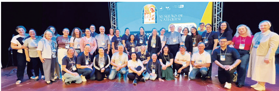
Integrantes do CNBB - Regional Sul 4 que estiveram no evento

Por Coordenação Diocesana de Catequese, com conteúdos da assessoria de comunicação CNBB Oeste 1/Agência Kerigma